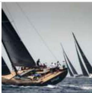
18/05/18 Mylius Cup 2018 Capri, May 16-19 2018