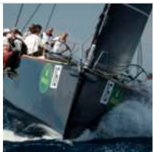
18/05/18 Mylius Cup 2018 Capri, May 16-19 2018