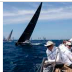
18/05/18 Mylius Cup 2018 Capri, May 16-19 2018